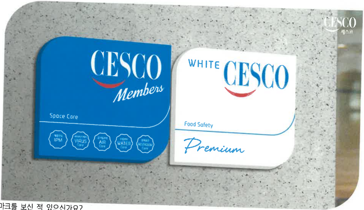
사진 속 마크를 보신 적 있으신가요?

세스코 서비스 디자이너가 계약 후 관리하고 있는 세스코멤버스 마크입니다.